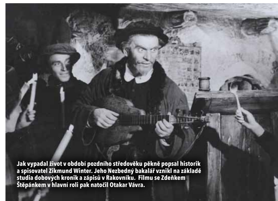
Jak vypadal život v období pozdního středověku pěkně popsal historik a spisovatel Zikmund Winter. Jeho Nezbedný bakalář vznikl na základě studia dobových kronik a zápisů v Rakovníku. Filmu se Zdeňkem Štěpánkem v hlavní roli pak natočil Otakar Vávra.