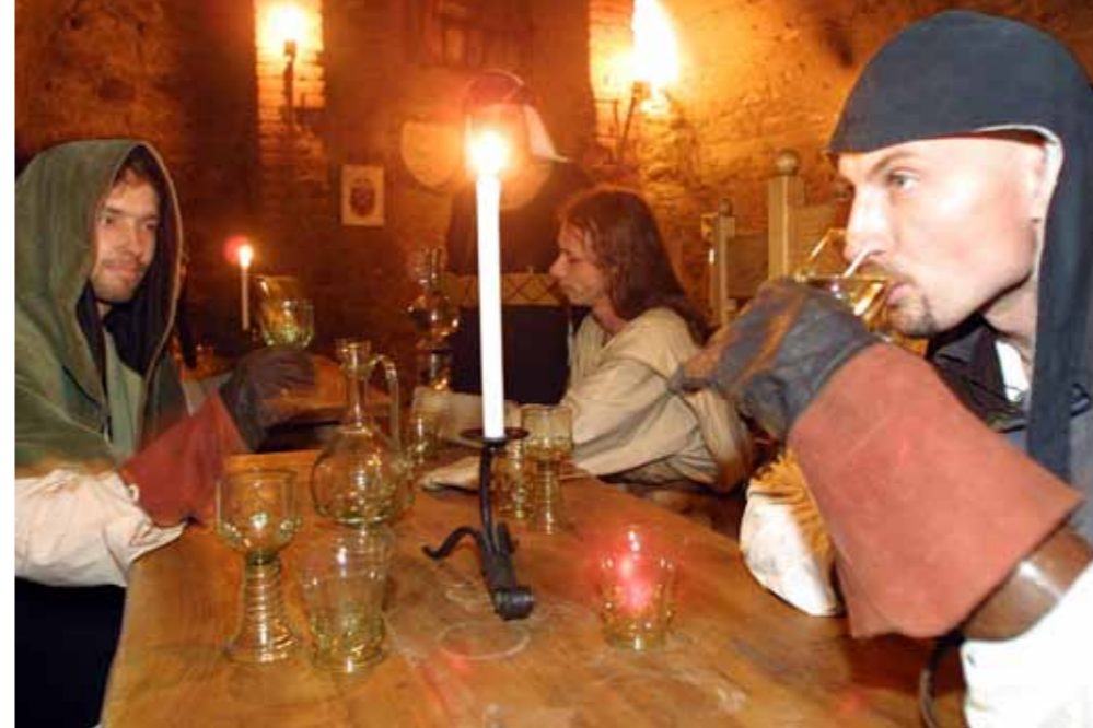
▲ Ve městech fungovalo cosi jako církevní či mravnostní policie. „Po hospodách chodily církevní komise a zkoumaly, zda se o pústu nenabízí maso,“ popisuje doc. Nodl.

Ve 14. století bylo dlážděných ulic velice málo, přičemž někdy bylo původní dláždění spíše dřevěné než kamenné. Ulice často bývaly jen hliněné, a když zapršelo, bylo asi dost dobrodružné se jimi brodit. Problémy se mnohdy řešily novými a novými navážkami sutí a kamení, takže původně vysoká okna se po sto letech dostala na úroveň va-